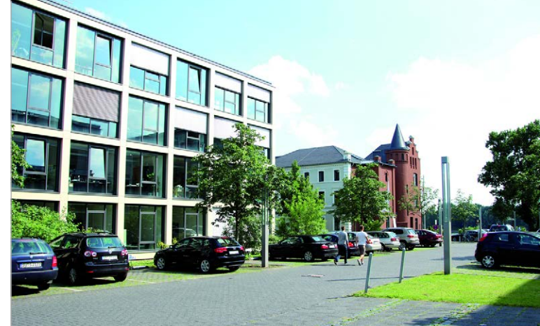
Kolleggebäude am Ende der Rheinwerkallee