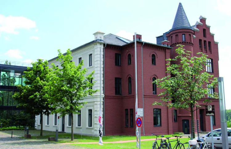
Das Gebäude des Käte Hamburger Kollegs „Recht als Kultur“