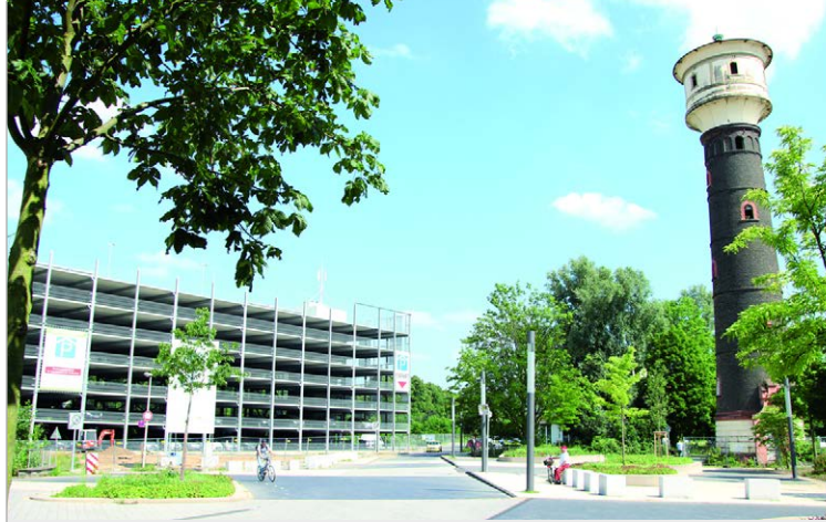
Parkhaus am Konrad-Zuse-Platz